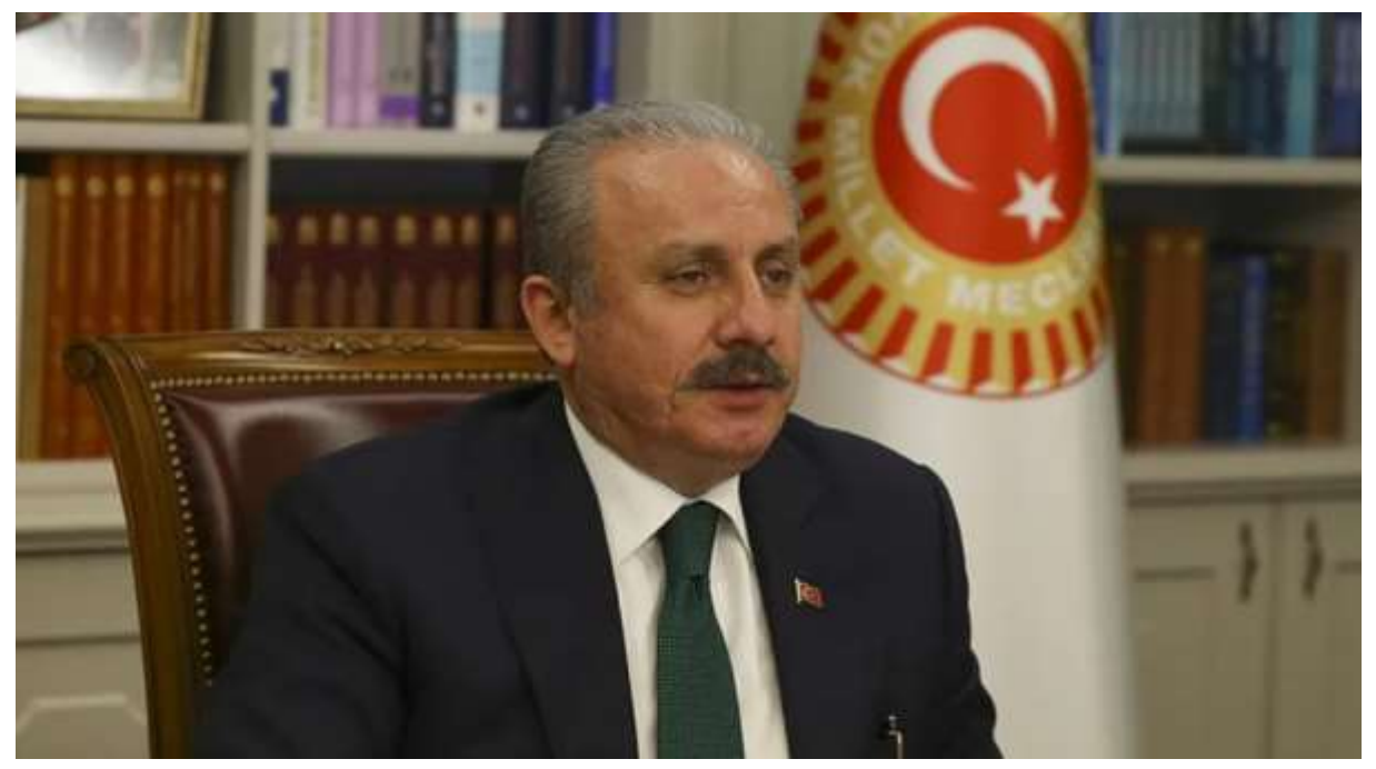
TBMM Genel Kurulu'nda güvenlik soruşturması ve arşiv araştırması teklifinin reddedilmesi üzerine Başkanlık Divanı toplandı.

TBMM Başkanı Şentop, Genel Kurul'da dün reddedilen güvenlik soruşturması teklifi ile ilgili, "Karar, Başkanlık tezkeresiyle açıklanacak." dedi.