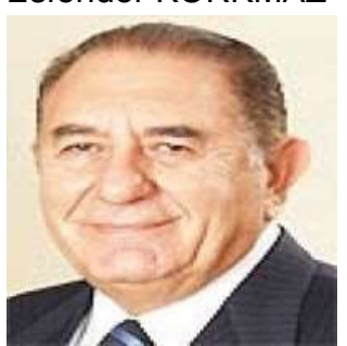
02 Nisan 2021

Küreselleşmenin önünü açan yeni liberal politikalar aynı zamanda dış ekonomik ilişkilerde sömürü düzenine uygun bir zemin oluşturdu. Dünya'da Çin, Tayvan, Güney Kore gibi cari fazla verip zenginleşen ülkeler oldu. Türkiye, Arjantin, Brezilya gibi cari açık verip göreceli olarak yoksullaşan ülkeler oldu. Türkiye mutlak yoksullaştı. Zira 2013 yılında 12480 dolar olan fert başına millî geliri 2020'de 8599 dolara geriledi. Türkiye olarak 2003 yılından, 2020 yılına kadar toplam 860,6 milyar dolar dış ticaret açığı verdik. 611 milyar dolar da cari açık verdik.