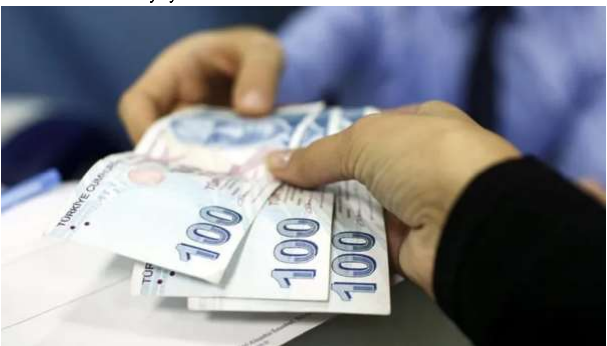
Vatandaşı TL varlıklara yatırımı özendirmek için atılan adımlardan stopaj desteği uygulaması haziran ve temmuz aylarını da kapsayacak şekilde uzatıldı.

Türk Lirası mevduatları teşvik etmek için getirilen ve 31 Mayıs'ta sona ermesi planlanan stopaj indiriminin üçüncü kez uzatılmasına ilişkin karar Resmi Gazete'de yayımlandı.