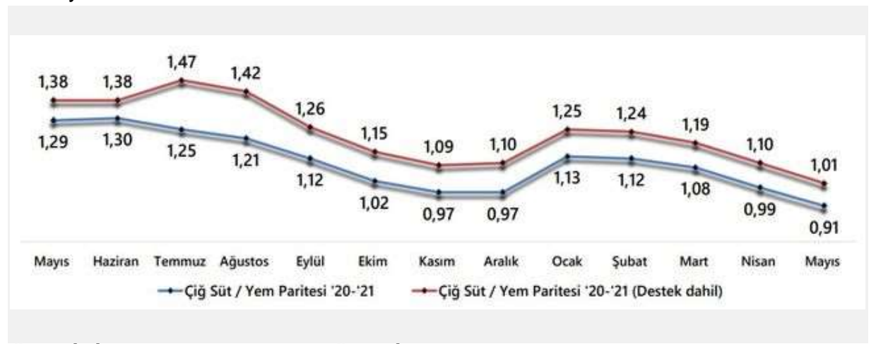
ÜRETİCİ, 2 AYDIR ZARARINA ÜRETİYOR

Hatta destekleme dahil edilmediği takdirde 1 litre süt satarak ancak 910 gram yem alabiliyor.