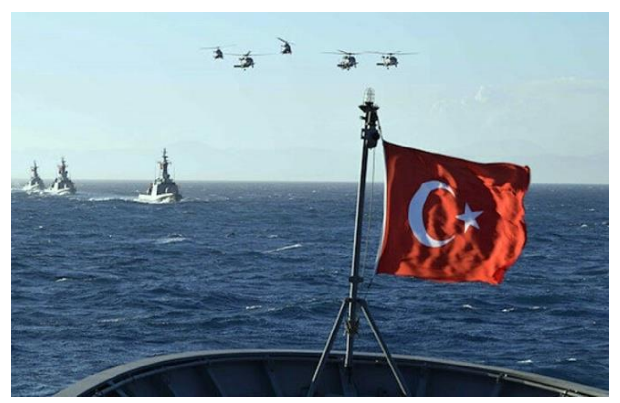
Birleşmiş Milletler (BM), Türkiye ve Libya arasındaki deniz sınırı anlaşmasını tescil etti.

BM, Türkiye ve Libya arasındaki deniz sınırı anlaşmasını tescil etti.