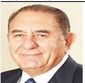
02 Ekim 2020

Açıklanan dış ticaret verilerine göre, Ağustos ayında genel ticaret sistemine göre ihracat yüzde 5,7 azaldı, ithalat yüzde 20,4 arttı.