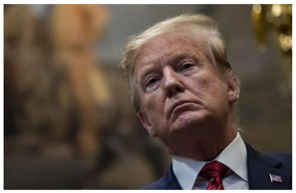
ABD Başkanı Donald Trump, kendisi ile eşi Melania Trump'ın koronavirüs testinin pozitif çıktığını açıkladı. ABD Başkanı Trump, COVID-19'a yakalandığını Twitter hesabından yaptığı açıklamayla duyurdu.

ABD Başkanı Donald Trump, kendisi ile eşi Melania Trump'ın COVID-19 testinin pozitif çıktığını açıkladı.