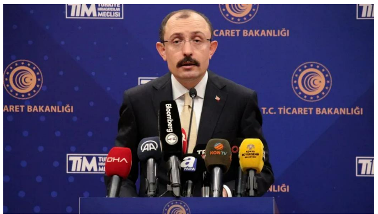
İMAM GÜNEŞ - KONYA

Türkiye ihracatı temmuz ayında büyümesini sürdürerek, yüzde 13,4 artışla 18,6 milyar dolara ulaştı. Yılın ilk 7 ayında büyüme kaydeden ihracat bu periyotta 144 milyar doları aştı. İthalat ise temmuz ayında yüzde 40,8'lik artışla 29,1 milyar dolar olurken, yılın ilk 7 ayında 206,4 milyar dolara yükseldi. Bu dönemde verilen dış ticaret açığı 62 milyar dolar oldu.