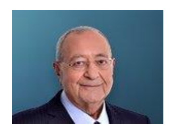
04 Ağustos 2022, Perşembe