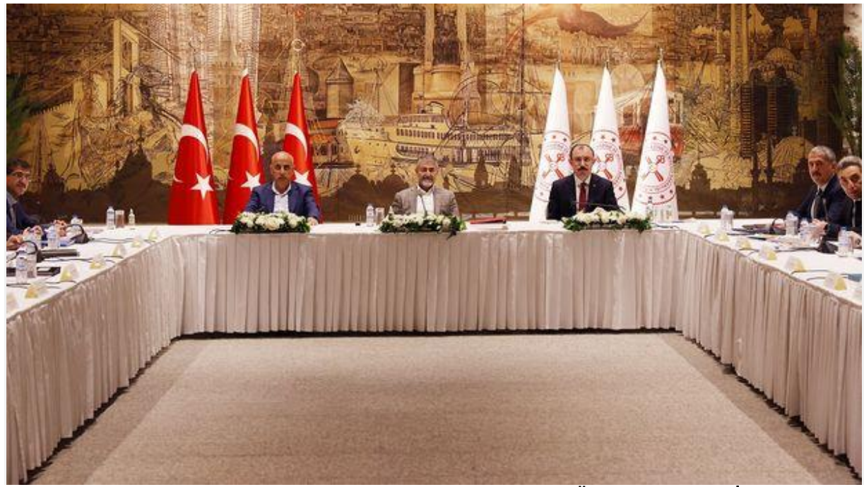
Hazine ve Maliye Bakanlığı tarafından Gıda ve Tarımsal Ürün Piyasaları İzleme ve Değerlendirme Komitesi Toplantısına İlişkin açıklama yapıldı.

Gıda fiyatlarının seyrine yönelik gelişmelerin ele alındığı Gıda Komitesi toplantısında yem fiyatları da gündeme geldi.