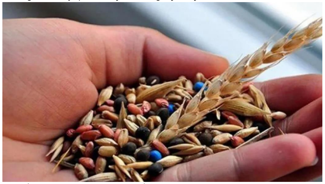
<u>Tarım</u> İşletmeleri Genel Müdürlüğü (TİGEM), Irak'a tohum satışı için bayilik yetkisi verilmesine ilişkin ilanı Resmi Gazete'de yayımlandı.

Tarım İşletmeleri Genel Müdürlüğü (TİGEM) tarafından üretilen tohumların 5 yıl süreyle Irak devletine satışı için bayilik yetkisi verilmesi ve dağıtımının yapılması işi ihalesi gerçekleştirilecek.