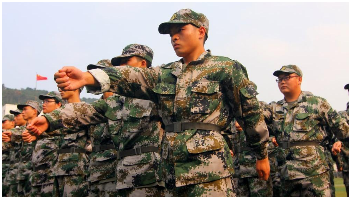
<u>ABD</u>'li siyasetçi Nancy Pelosi'nin ziyareti sonrasında gerilimin tırmandığı Tayvan-<u>Çin</u> hattında dikkat çekici olduğu kadar da endişe yaratan bir gelişme yaşanıyor...

Son haftalarda gerilimin had safhada olduğu Tayvan-Çin hattında bugün kritik gelişmeler arka arkaya yaşanıyor. Çin ordusu yerel saatle 12.00'de gerçek silah kullanarak Tayvan'ın çevresinde tatbikata başladı.