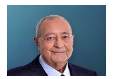
08 Kasım 2022, Salı