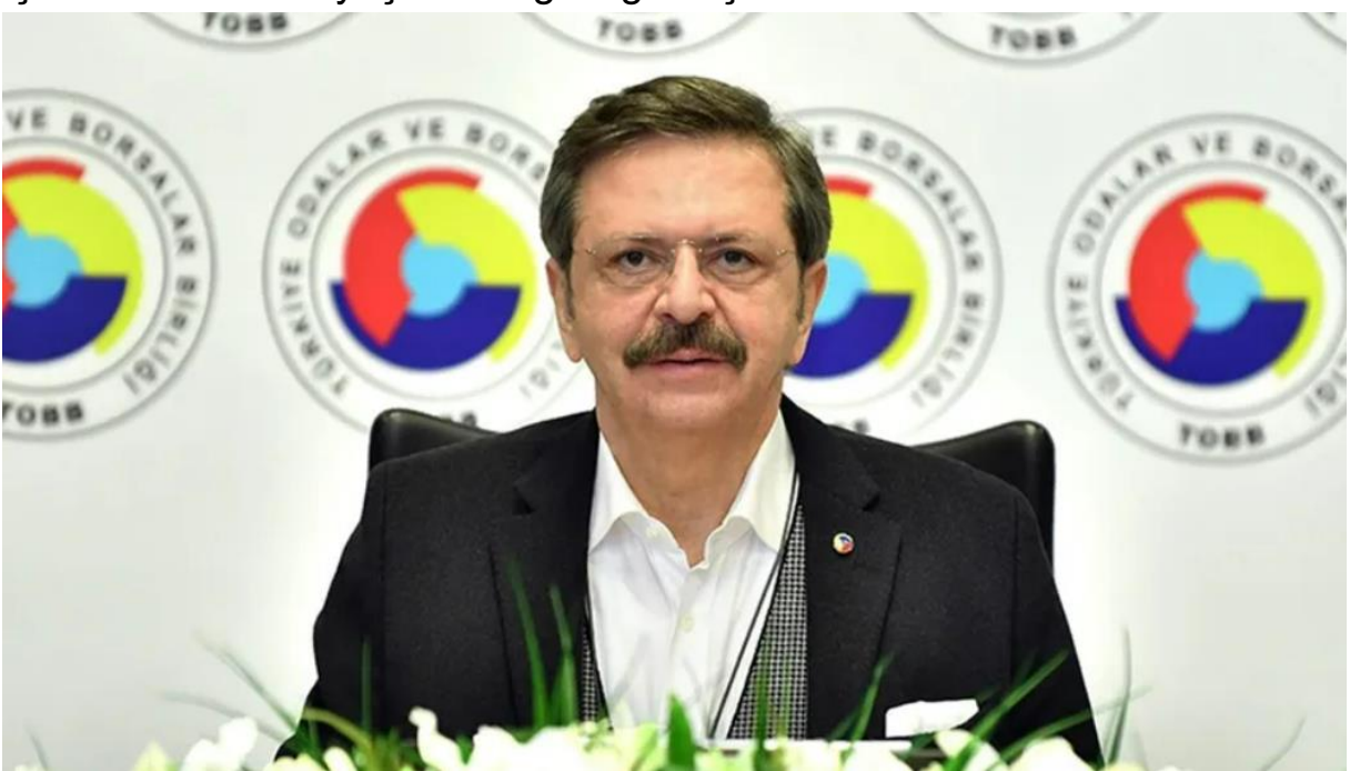
TOBB Başkanı Rifat Hisarcıklıoğlu, enflasyon muhasebesine ilişkin bir açıklama yaprı.

TOBB Başkanı Rifat Hisarcıklıoğlu, enflasyon muhasebesinin firmalar için zorunlu bir ihtiyaç haline geldiğini açıkladı.