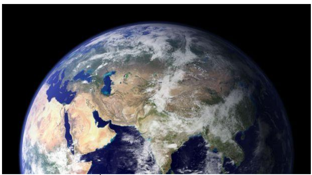
Birleşmiş Milletler (BM) İklim Değişikliği Çerçeve Sözleşmesi 27. Taraflar Konferansı (COP27), Mısır'ın Şarm eş-Şeyh kentinde başladı.

BM İklim Zirvesi'nde, sera gazı emisyonlarını azaltım planları, iklim değişikliğine adaptasyon, gelişmekte olan ülkelere taahhüt edilen iklim tazminatı gibi konular, en önemli gündem maddelerini oluşturuyor.