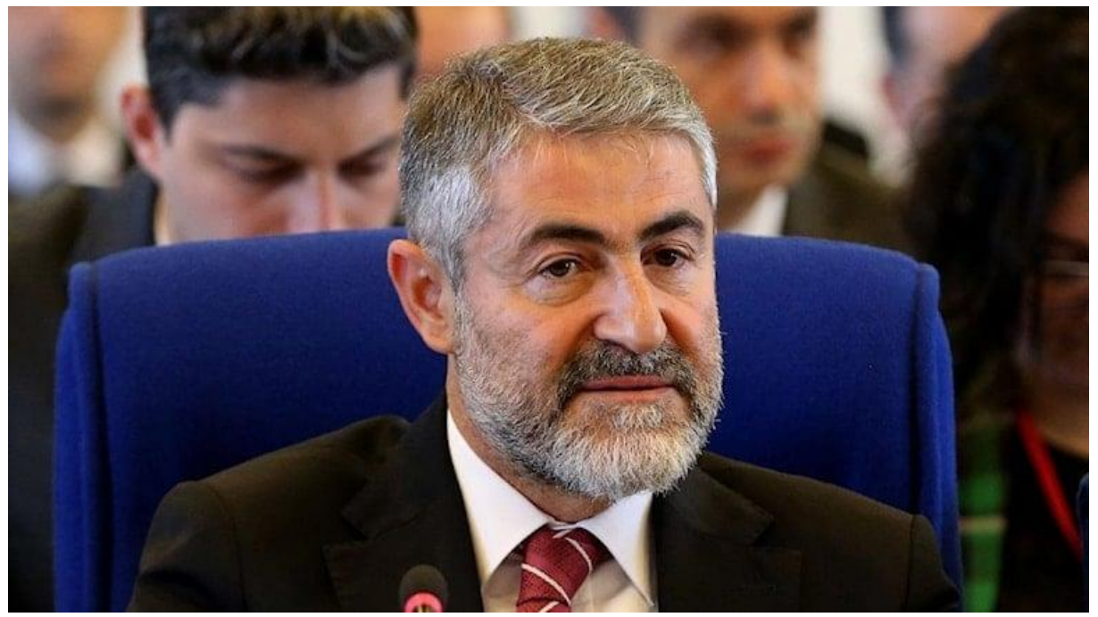
Hazine ve Maliye Bakanı Nureddin Nebati, ticari kredi faizlerine ilişkin yeni açıklamalarda bulundu.

Hazine ve Maliye Bakanı Nureddin Nebati, "Temmuz sonunda ticari kredi faizleri yüzde 30 civarındayken şimdi yüzde 18'lere geriledi. KOBİ kredileri ise tarihsel ortalamasının 3 katından daha fazla büyüdü" dedi.