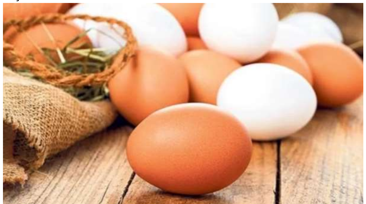
Türkiye İstatistik Kurumu, 2021 yılı Temmuz ayına ilişkin kümes hayvancılığı üretimi verilerini açıkladı.

Türkiye genelinde tavuk yumurtası üretimi 2021 yılı Temmuz ayında geçen yılın aynı ayına göre yüzde 1,7 azalarak 1 milyar 515 milyon 794 bin adede, tavuk eti üretimi de yüzde 7,1 gerileyerek 161 bin 923 tona düştü.