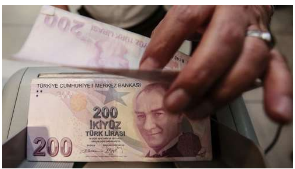
Tarım ve Orman Bakanı Pakdemirli, 43 ilde kuraklıktan zarar gören 14 bin 213 üreticiye 214 milyon lira ödeme yapıldığını bildirdi.

Tarım ve Orman Bakanı Bekir Pakdemirli, Tarım Sigortaları Havuz İşletmeleri AŞ (TARSİM) tarafından 43 ilde kuraklıktan zarar gören 14 bin 213 üreticiye 214 milyon lira hasar ödemesi yapıldığını duyurdu.