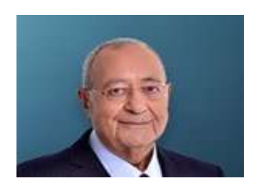
10 Eylül 2021, Cuma