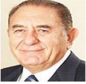
11 Mart 2021

İşsizlik sosyal probleme dönüştü Esfender KORKMAZ