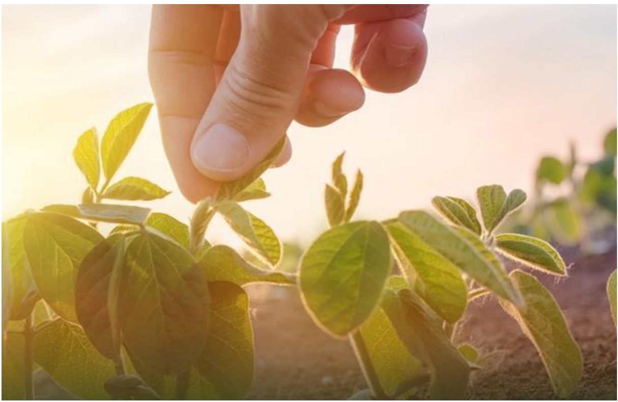
11 Mayıs 2020

Tarım sektörüne yönelik yeni bir rapor hazırlayan Kredi Kayıt Bürosu, "Koronavirüsün Tarım ve Gıda Sektörüne Etkileri" başlıklı raporunda, salgının makroekonomik etkileri ile tarımsal üretime ve tarım değer zincirinin diğer paydaşlarına etkisini ortaya koydu.