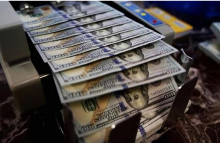
12 Mayıs 2020

7,27'lik tarihi seviyeleri gördükten sonra düşüşe geçen dolar/TL, güne 7,05 seviyelerinden başladı. Salgında ikinci dalga endişesi, küresel piyasalar üzerinde baskı unsuru olmaya devam ediyor.