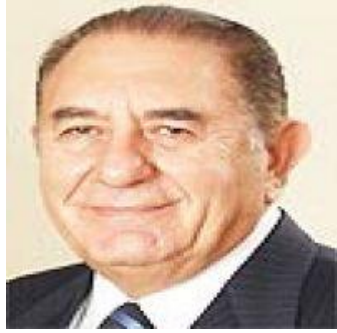
12 Mayıs 2020

Pazar günkü yazımda, mevcut verilere dayanarak Türkiye'nin orta gelir tuzağında ve fakirlik kısır döngüsü içinde olduğu tespitini yapmıştım. Bir ülkenin kalkınma süreci içinde en zor olanı bu döngüden kurtulmaktır. Bu döngüye sokan politikaları dışlayıp yeni politikalar uygulamak gerekir. Türkiye, dinamik insanı, stratejik konumu, doğası ve imkanları ile orta gelir tuzağını ve fakirlik kısır döngüsünü hak etmiyor.