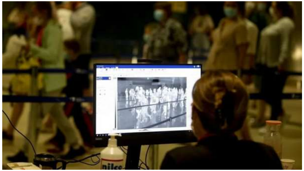
Rusya Başbakan Yardımcısı Tatiana Golikova, Türkiye'ye uçuşların artan vaka sayıları nedeniyle sınırlandırılmasına karar verildiğini açıkladı.

Rusya, Türkiye'ye yönelik uçuşların 15 Nisan'dan 1 Haziran'a kadar sınırlandırılmasına karar verdi.