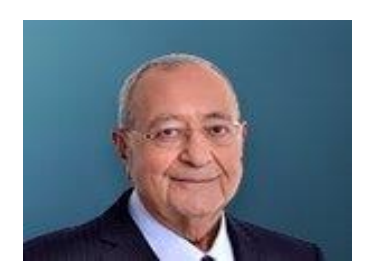
13 Nisan 2022, Çarşamba