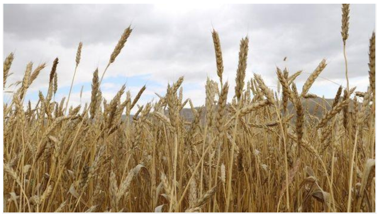
Oxfam, Rusya'nın Ukrayna'da başlattığı savaş, etkileri süren pandeminin ve küresel eşitsizliğin aşırı yoksulluk içinde yaşayan insanların sayısını artıracağını rapor etti.

Uluslararası yardım kuruluşu Oxfam, Rusya'nın Ukrayna işgali, Kovid-19 pandemisinin süren etkisi ve artan küresel eşitsizlik karşısında bu yıl sonuna kadar 263 milyon insanın aşırı yoksulluğa sürüklenebileceği, 860 milyon insanın da aşırı yoksulluk içinde yaşayabileceği uyarısında bulundu.