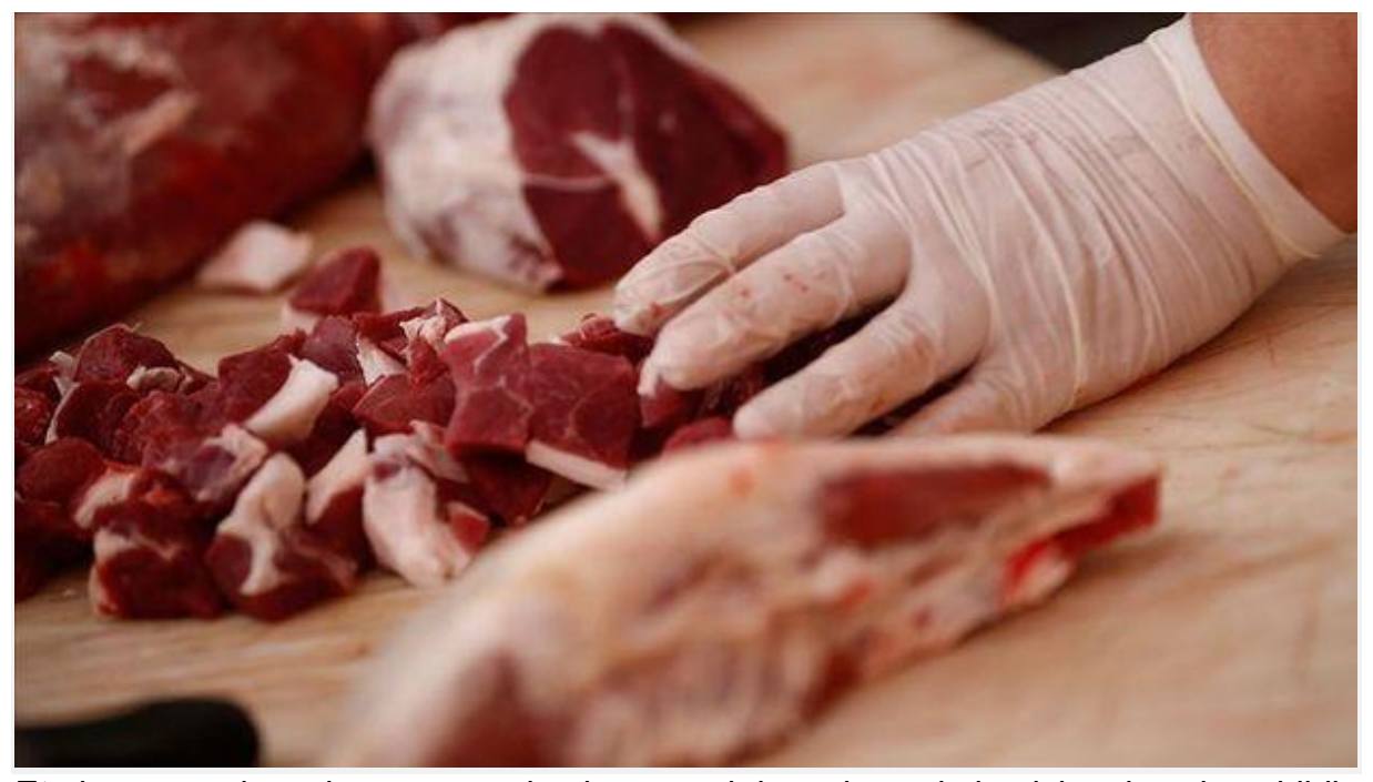
Et piyasasını düzenleme amacıyla alınan yeni düzenlemeyle besiciye destek getirildi.

Resmi Gazete'de yayımlanan Cumhurbaşkanı kararıyla 2 Nisan-1 Mayıs tarihleri arasında Et ve Süt Kurumu tarafından kesimi ve satımı yapılan/yaptırılan her bir baş sığır için 2 bin 500 TL destekleme yapılacak.