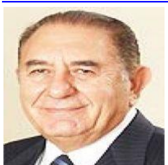
14 Nisan 2020

Dünya Sağlık Örgütü 2019 raporunda, sağlığı etkileyecek tehlikeleri açıklamıştı. İlk sırada aşıya karşı direnç, ikinci sırada grip yer almıştı. Buna rağmen virüs krizinde birçok ülke önlem almakta geç kaldı, başarısız oldu. Bu durum dünya kamuoyunda zihinlerde "nasıl bir devlet-nasıl bir düzen?" sorusuna yol açtı.