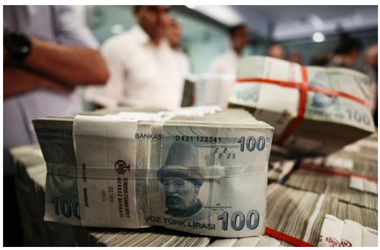
14 Nisan 2020

Bankacılık Düzenleme ve Denetleme Kurumu (BDDK) Başkanı Mehmet Ali Akben'in bankalara ilettikleri talimatların uygulamasını yakından izleyeceklerini söylemesinin ardından BDDK'ya iş dünyasından destek geldi.