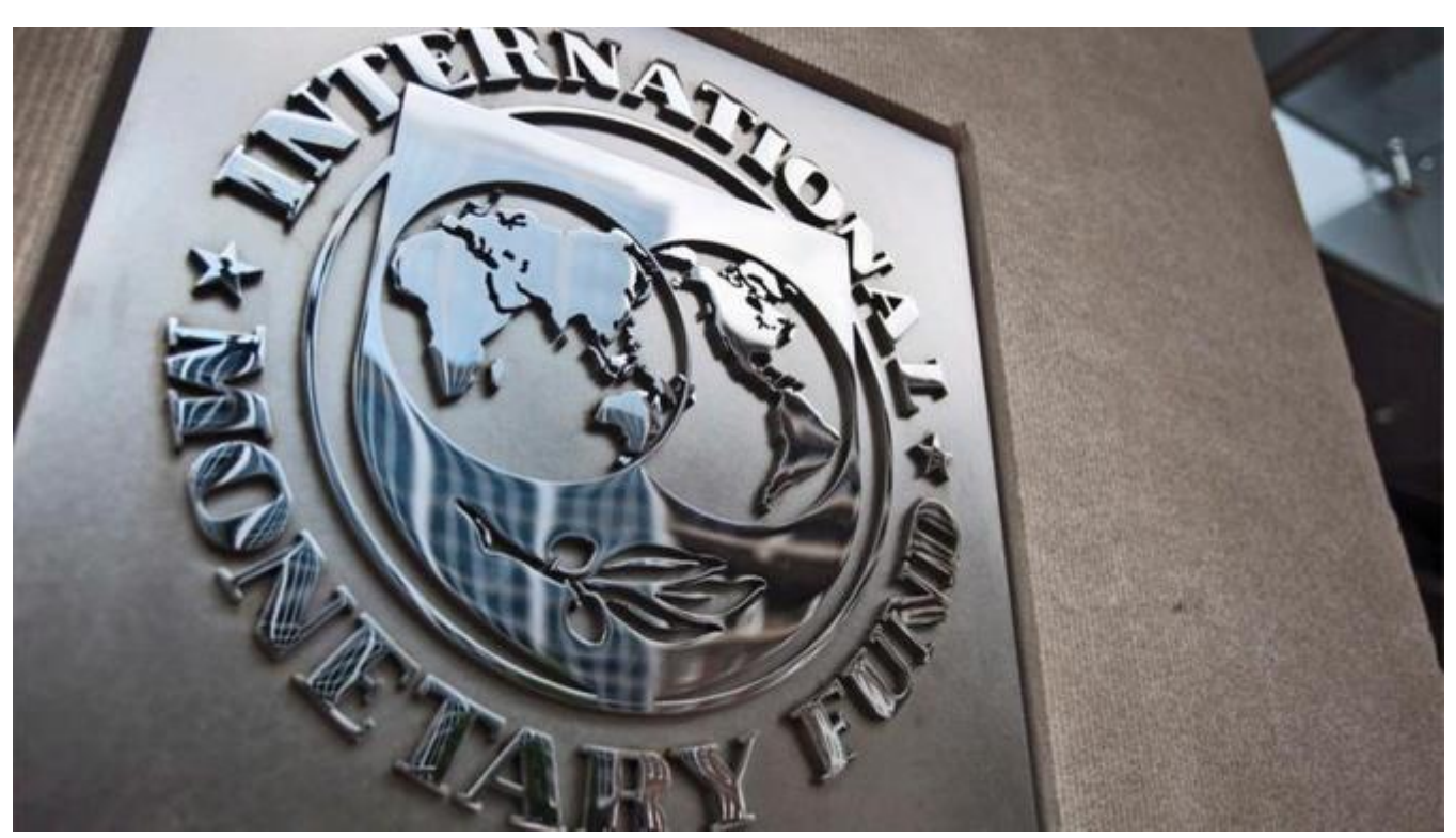
14 Nisan 2020

IMF Başkanı Kristalina Georgieva, koronavirüs salgınının etkileriyle mücadeleye yardımcı olmak amacıyla, Afet Etkilerinin Sınırlandırılması ve Borcun Hafifletilmesi Fonu kapsamında 25 üye ülkeye acil borç yardımı sağlanacağını bildirdi.