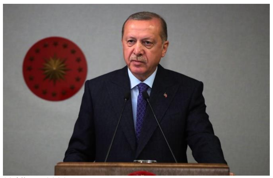
13 Nisan 2020

Cumhurbaşkanı Erdoğan, bu hafta da cumartesi ve pazar günü sokağa çıkma yasağı uygulanacağını belirterek "Hafta sonları sokağa çıkma yasağını önümüzdeki dönemde de ihtiyaç duyuldukça sürdürme kararı aldık" açıklamasında bulundu.