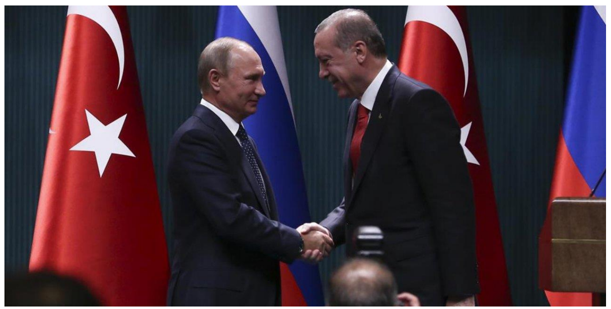
Cumhurbaşkanı Tayyip Erdoğan , Şanghay İşbirliği Örgütü Zirvesi'ne katılmak üzere Özbekistan'a gidecek. Toplantıya ev sahipliği yapan Özbekistan Cumhurbaşkanı Şevket Mirziyoyev 'in davetiyle toplantıya katılacak Erdoğan, zirve kapsamında bir dizi ikili temasta bulunacak.

Cumhurbaşkanı Erdoğan yarın Özbekistan ev sahipliğinde düzenlenecek Şanghay İşbirliği Örgütü Zirvesi'ne katılacak. Erdoğan'ın zirve kapsamında Rusya Devlet Başkanı Putin ile Çin Devlet Başkanı Şi ile görüşmesi bekleniyor.