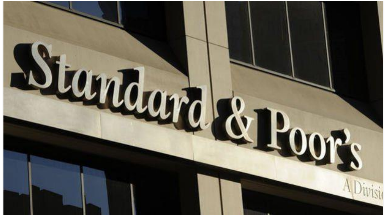
S&P'den yapılan açıklamada, gübre fiyatlarının Kovid-19 salgını sonrası yaşanan arz kesintileri, Rusya-Ukrayna savaşı ve Çin'in ihracat kısıtlamaları nedeniyle tarihi ve sürdürülemez seviyelere ulaştığı aktarıldı.

Uluslararası kredi derecelendirme kuruluşu Standard&Poor's (S&P), sürdürülebilir olmayan derecede yüksek gübre fiyatlarının gıda güvencesi için bir risk olduğunu bildirdi.