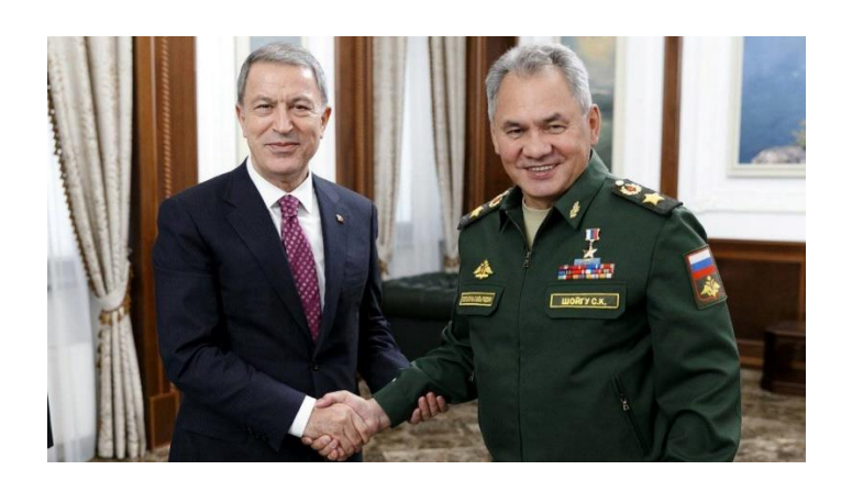
Bakan Akar ve Rusya Savunma Bakanı Sergey Şoygu

Cumhurbaşkanı Recep Tayyip Erdoğan'ın çözüme yönelik diplomatik çalışmaları sürerken, Milli Savunma Bakanlığı da harekete geçti.