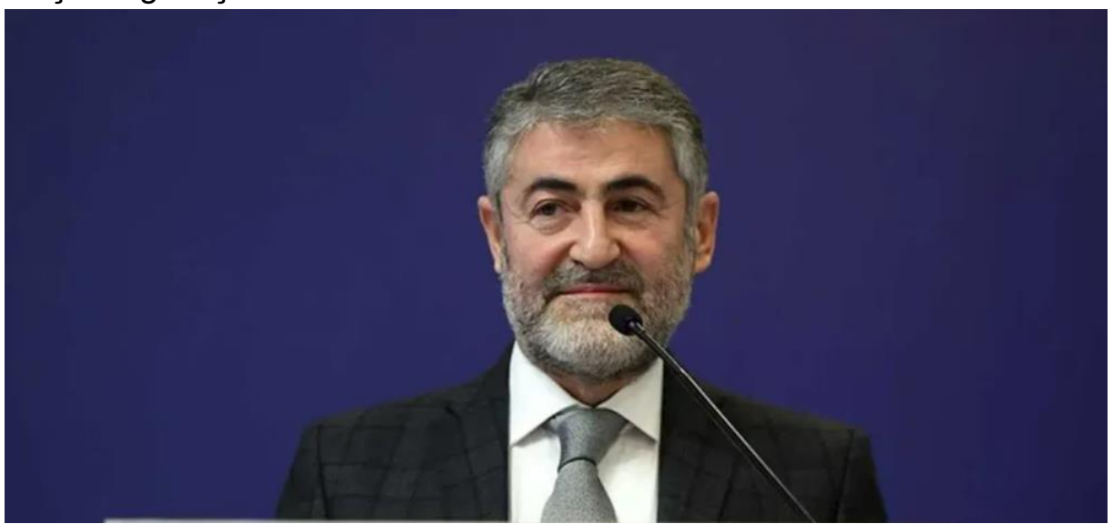
Hazine ve Maliye Bakanı Nebati, sosyal medya hesabından yaptığı paylaşımda, 2022 yılı Mayıs ayı merkezi yönetim bütçe gerçekleşmelerini değerlendirdi.

Hazine ve Maliye Bakanı Nureddin Nebati, mayısta 144 milyar lira bütçe fazlası, 161,9 milyar lira faiz dışı fazla verildiğini bildirerek, "Bütçe açığının GSYH'ye oranla sene başında öngörülen yüzde 3,5 hedefine ulaşılacağını işaret etmektedir." ifadesini kullandı.