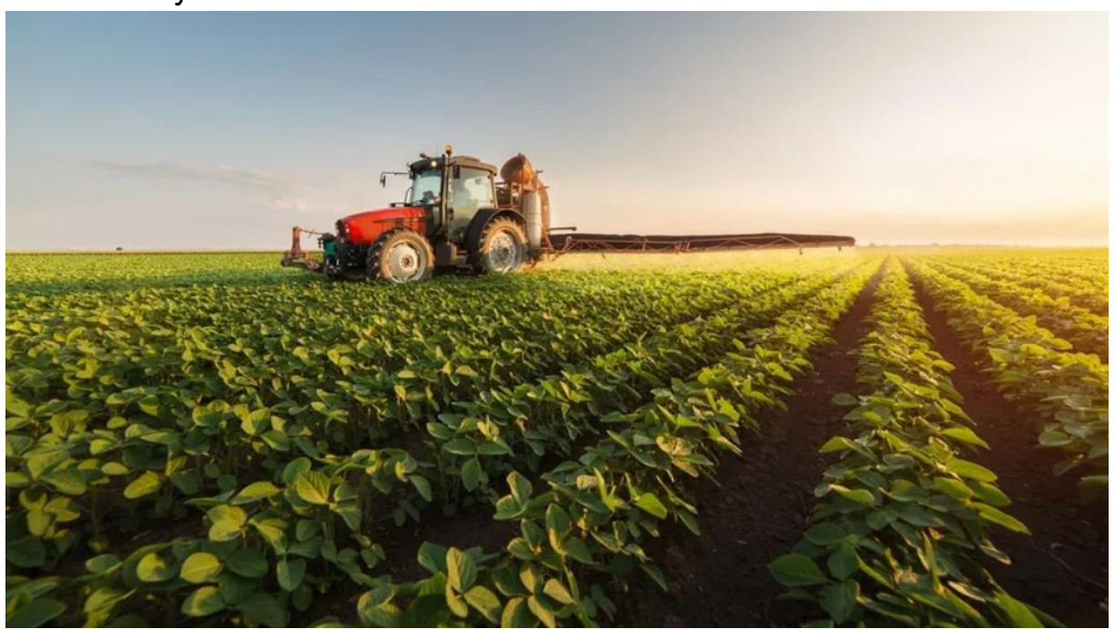
Tarım ve Orman Bakanlığı, yurt dışında yapılması planlanan tarım ve gıda ürünleri yatırımlarını duyurdu.

Tarım Bakanlığı, yurt dışında yapılması planlanan tarım ve gıda ürünleri yatırımlarını duyurdu. Venezuela'da Türkiye için ayrılan ve "Turkish land" olarak adlandırılan bölgede tarımsal yatırım yapılacak ve elde edilecek hasılatın yüzde 70'inin yatırımcıya, geri kalan yüzde 30'luk kısmının da Venezuela'ya bırakılacak.