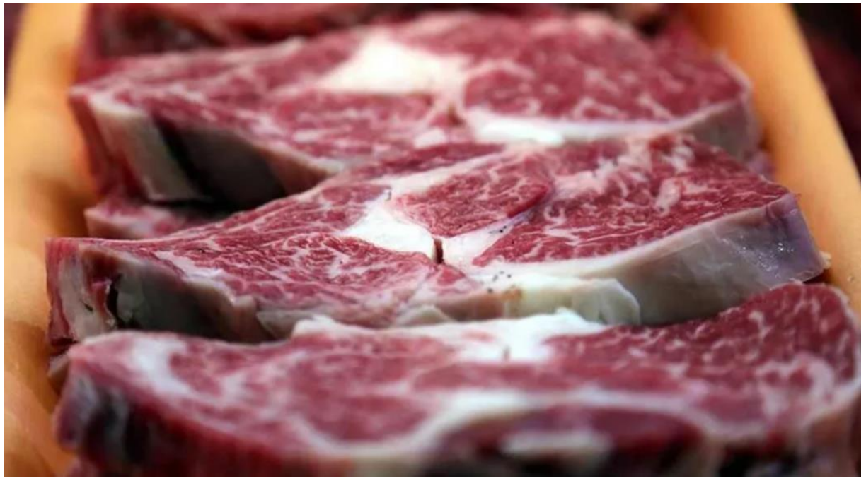
ESK büyükbaş hayvanların alım fiyatlarında güncelleme yaptı. Buna göre, 1'inci kalite 57 randımanlı yağsız kesim büyükbaş hayvan alım fiyatını kilogram başına 84 lira olarak belirledi.

Et ve Süt Kurumu (ESK) büyükbaş karkas etin üreticiden alım fiyatını yükseltti.