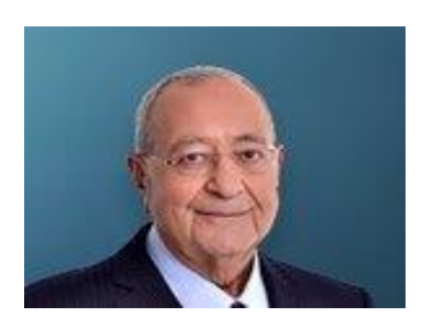
16 Haziran 2022, Perşembe