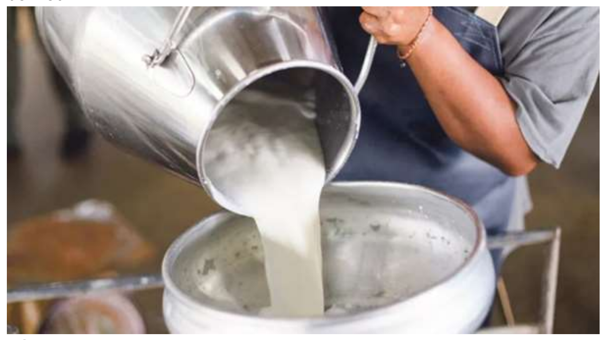
Ali Ekber YILDIRIM

Gıda Komitesi çiğ süt referans fiyatını 1 Temmuz-31 Aralık 2021 tarihlerinde geçerli olmak üzere litre başına 3 lira 20 kuruş olarak belirledi.