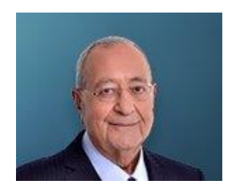
19 Ekim 2020, Pazartesi BASYAZIMEHMET BARLAS