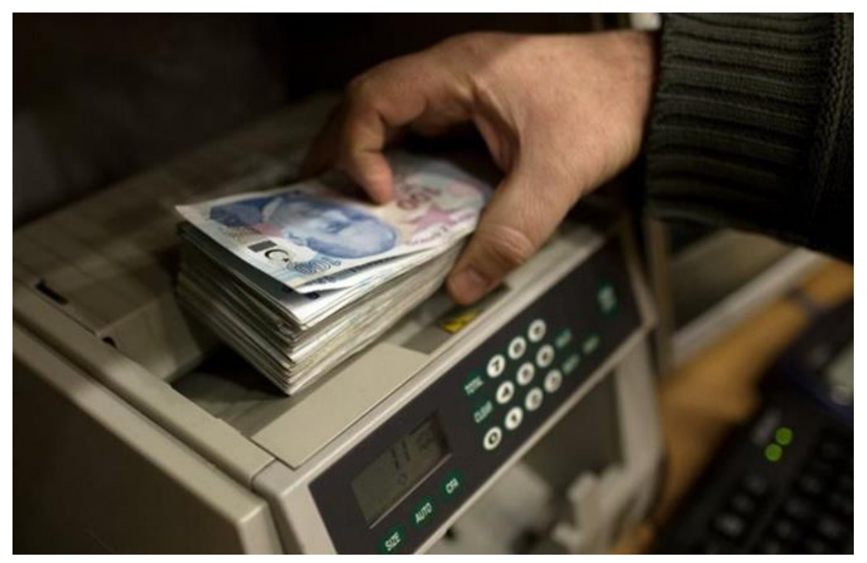
2021 Yılı Merkezi Yönetim Bütçe Kanun Teklifi, Cumhurbaşkanı Recep Tayyip Erdoğan'ın imzasıyla Meclise sunuldu. 2021 yılı bütçe büyüklüğü 1 trilyon 346,1 milyar TL olarak öngörüldü.

2021 Yılı Merkezi Yönetim Bütçe Kanun Teklifi, Meclis'e sunuldu. Teklifte bütçe giderleri 1 trilyon 346,1 milyar lira, faiz hariç giderler 1 trilyon 166,6 milyar lira, bütçe gelirleri 1 trilyon 101,1 milyar lira, vergi gelirleri 922,7 milyar lira, bütçe açığı 245 milyar lira olarak öngörüldü.