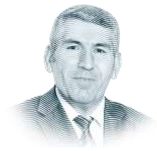
Ali Ekber YILDIRIM 22 Mart 2021 Pazartesi

Ticaret Bakanlığı İhracat Genel Müdürlüğü, Tarım ve Orman Bakanlığı'nın talebi üzerine 20 yıl aradan sonra zeytinyağının dökme olarak ihraç edilmesine yasak getirdi. Bundan 20 yıl önce o zamanki adıyla Dış Ticaret Müsteşarlığı 25 Aralık 2001 tarihinde aldığı kararla dökme zeytinyağı ihracatını 31 Ekim 2002 tarihine kadar yasaklamış ve büyük tartışmalara neden olmuştu. Aradan geçen 20 yılın sonunda yine zeytinyağının dökme olarak ihracatı yasaklandı. Alınan karar doğrultusunda 31 Ekim 2021 tarihine kadar zeytinyağı dökme olarak ihraç edilemeyecek. Sadece kutulu, ambalajlı ihraç edilmesine izin veriliyor.