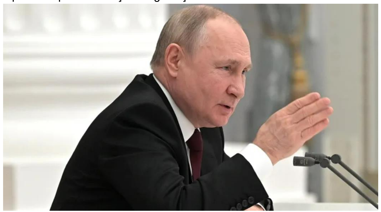
Putin, "Donetsk ve Luhansk'daki anlaşmazlıkların müzakere yoluyla çözülmesini bekliyoruz. Şimdilik mümkün görünmese de gelecekte başarılı olacağız" dedi. Putin, "Minsk anlaşmalarının artık geçerliliği yok. Donetsk ve Luhansk'ı tanıdık" diye konuştu.

Rusya Parlamentosunun üst kanadı Federal Meclis, Rusya Devlet Başkanı Vladimir Putin'in Rus ordusunun yurtdışında konuşlandırılmasına yönelik talebine onay verdi. Rusya, Ukrayna'daki diplomatik personelini çekeceğini açıkladı.