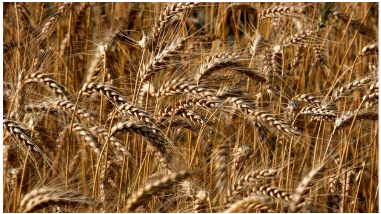
Rusya ile Ukrayna arasındaki gerginlik nedeniyle bölgede enerji güvenliği gündeme gelirken, küresel buğday ticaretindeki olası aksaklıklar bir başka kritik risk unsuru olarak ön plana çıkıyor.

Dünyanın en büyük buğday ihracatçısı Rusya ile beşinci ihracatçı Ukrayna arasında olası bir savaş, küresel buğday piyasalarını da derinden sarsacak. Analistler olası bir çatışmanın Karadeniz'e sıçraması ve buğday ticaretinde yaşanabilecek ufak aksaklıkların dahi küresel buğday fiyatlarında yüzde 10 ila 20 civarında artışa neden olabileceği uyarılarında bulunuyor.