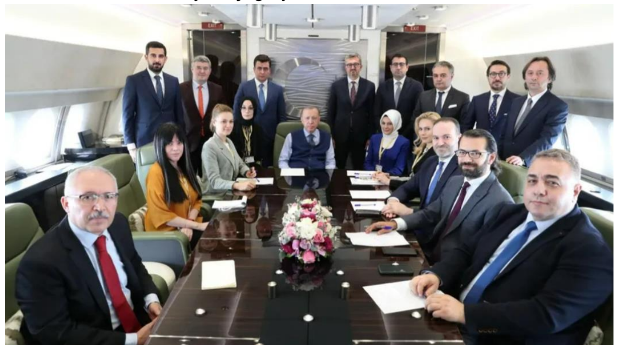
Cumhurbaşkanı Recep Tayyip Erdoğan, Afrika ziyareti kapsamında Kongo Demokratik Cumhuriyeti'nden Senegal'e geçerken uçakta gündemi değerlendirdi, soruları yanıtladı.

Cumhurbaşkanı Erdoğan, Rusya'nın Donetsk ve Luhansk'ı tanıması ile ilgili, "Kararı kabul edilmez olarak değerlendiriyoruz. Tarafları sağduyu ve uluslararası hukuka riayete çağırıyoruz." dedi.