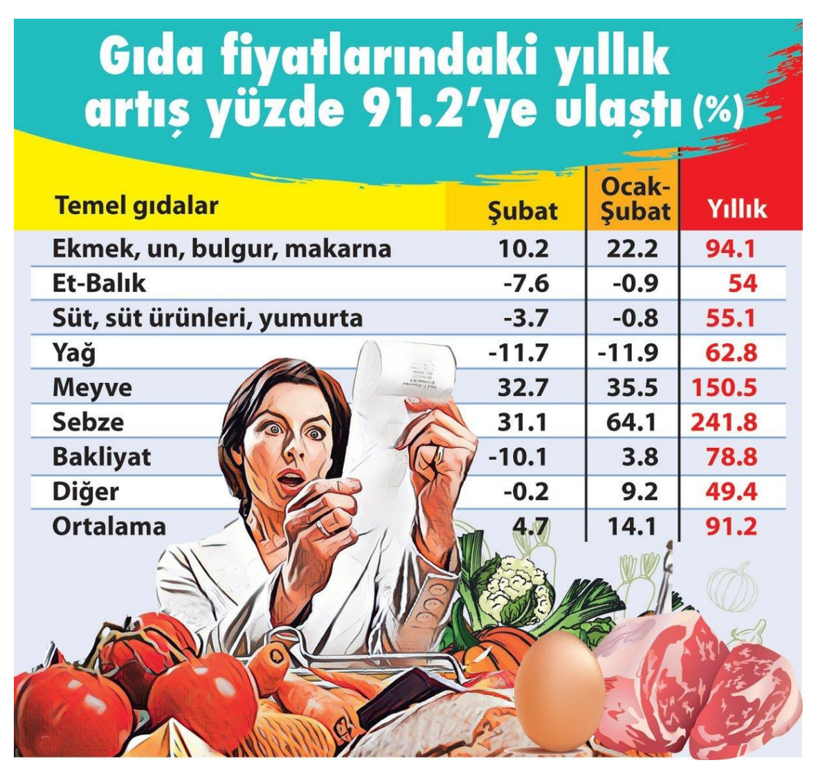
Sadece gıda fiyatları yüzde 91.2 arttı

Ekmek, un, bulgur ve makarna fiyatları ise şubat ayında yüzde 10.2, yıl başından bu yana da yüzde 22.2 zamlandı. Aynı şekilde şubatta meyve fiyatları yüzde 32.7, sebze fiyatları yüzde 31.1 artarken 2022'nin ilk iki aylık döneminde ise meyve yüzde 35.5, sebze fiyatları da yüzde 64.1'lik zam gördü. Yıllık artış meyvede yüzde 150'yi, sebzede yüzde 241'i aştı.