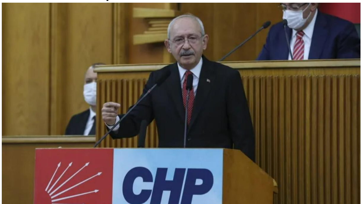
CHP Genel Başkanı Kemal Kılıçdaroğlu, partisinin TBMM Grup Toplantısı'nda yaptığı konuşmada, Türkiye'nin sorunlarını bildiklerini, çözüm üreten insanların iktidar olduğu takdirde çözülmeyecek hiçbir sorunun olmadığını söyledi.

CHP lideri Kılıçdaroğlu, Rusya-Ukrayna krizi konusunda, "Bölgedeki bir savaşın Türkiye'ye büyük zararlar vereceğini hepimiz biliyoruz. Tarafları sağduyuya davet etmek, bir savaşı önlemek sadece insan olarak bizim değil aslında bütün dünyanın ortak talebi olarak ortaya çıkmak zorundadır. Eğer böyle bir savaş çıkarsa en büyük zararı görecek olan ülkelerden birisi Türkiye'dir." dedi.