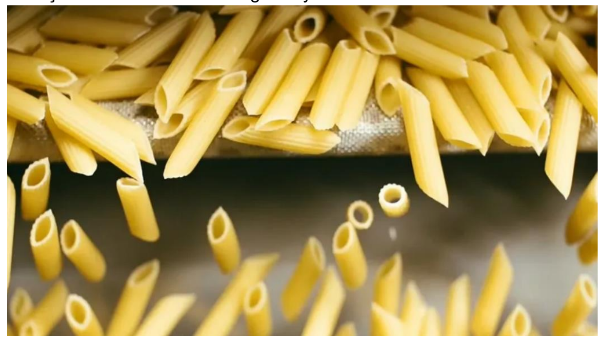
Mehmet Hanifi GÜLEL

Türkiye makarna sektörünün iç ve dış ticaret hacmi ile birlikte değerlendirildiğinde 2 milyar dolarlık bir büyüklüğe ulaştığını kaydeden Türkiye Makarna Sanayicileri Derneği Yönetim Kurulu Başkanı Muhittin Aykut Göymen, bu yıl üretimin yaklaşık 100 bin ton artırarak 2,2 milyon tona çıkarılmasının hedeflendiğini söyledi.