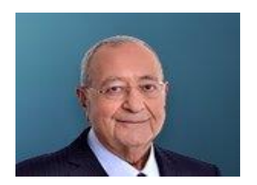
26 Ekim 2022, Carsamba