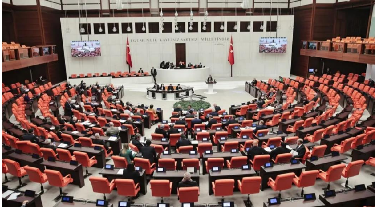
Hüseyin GÖKÇE - Canan SAKARYA

3600 ek gösterge düzenlemesinin yer aldığı yasa teklifi Meclis'e sunuldu. Teklifte herhangi bir yükseköğretim kurumundan ayrılanlar için getirilen af düzenlemesi de yar alıyor. Yasa teklifi ile emekli aylıklarının alt sınırı 2.500 TL'den 3.000 TL'ye yükseltiliyor. Bankalara yüzde 25'lik kurumlar vergisi sürekli hale getiriliyor.