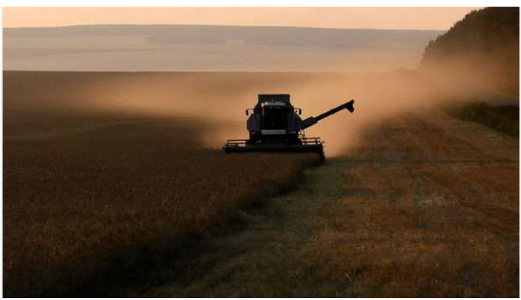
Küresel sıcaklığın artması buğday ve kanola fiyatlarına da yansıdı.

Son dönemde rekor kaydeden sıcaklıklar tarımsal emtia fiyatları üzerinde de olumsuz etki yaptı. Bahar buğdayı fiyatları 2017 yılından bu yana en yüksek seviyeye çıktı. Kanola vadelilerinde ise rekor kaydedildi.