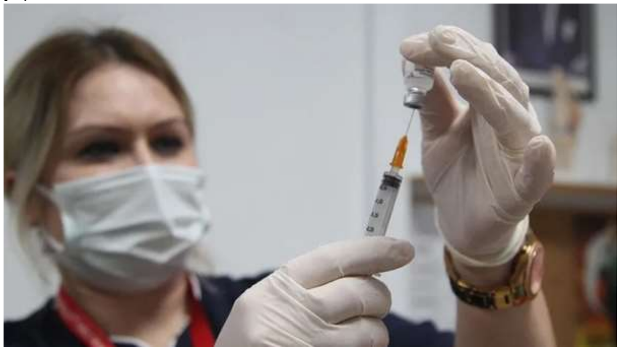
Türkiye, bugüne kadar 1 milyar 874 milyon dozdan fazla COVID-19 aşısının uygulandığı dünya genelinde 28 milyon 811 bini aşkında doz ile 10'uncu sırada yer aldı.

Dünya genelinde 1 milyar 874 milyon dozdan fazla COVID-19 aşısı yapılırken, Türkiye 28 milyon 811 bin dozu aşkın aşı ile en çok aşılama yapılan 10'uncu ülke oldu.