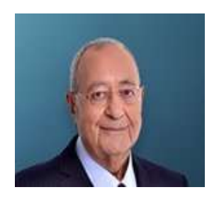
31 Mayıs 2021, Pazartesi BAŞYAZIMEHMET BARLAS