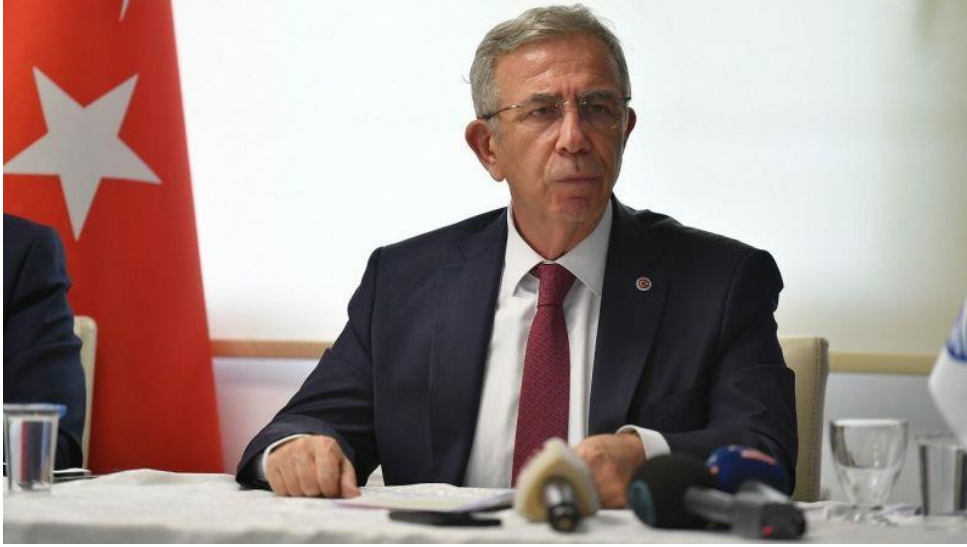
ABB Başkanı Mansur Yavaş, ASKİ'nin zaten maliyetinin yarısına ücretlendirdiği su tarifelerinde yüzde 50 daha indirim kararı alınmasının "yasa dışı olduğunu ve mahkemeden döneceğine inandığını" söyledi.

Ankara Büyükşehir Belediye Başkanı Mansur Yavaş 1,5 milyon vatandaşa sağlıklı ve kaliteli içme suyu sağlayacak olan 107 kilometrelik İvedik-Temelli-Polatlı İçme Suyu Hattı projesinin de etkilendiği "suda indirim" kararı nedeniyle ASKİ Polatlı Bölge Müdürlüğü'nde basın mensuplarıyla bir araya geldi.