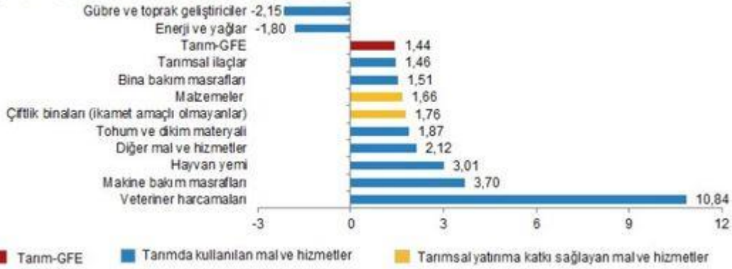
Alt gruplara göre Tarım-GFE aylık değişim oranı (%), Kasım 2023

Bir önceki aya göre azalış gösteren alt gruplar sırasıyla, yüzde 2,15 ile gübre ve toprak geliştiriciler ve yüzde 1,80 ile enerji ve yağlar oldu. Buna karşılık, aylık artışın yüksek olduğu alt gruplar ise sırasıyla, yüzde 10,84 ile veteriner harcamaları ve yüzde 3,70 ile makine bakım masrafları oldu.