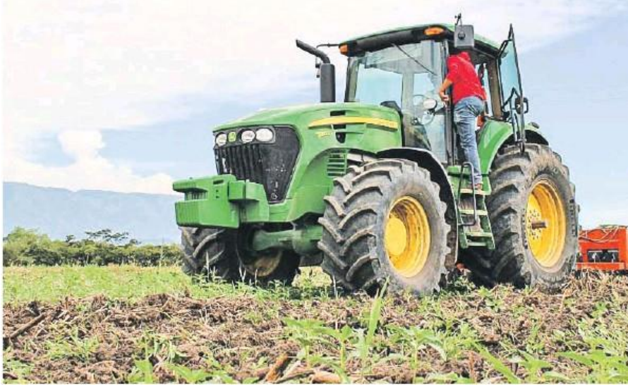
30 bin liralık traktör 60 bin liraya kadar çıktı

CHP İstanbul Milletvekili Mahmut Tanal, ikinci el traktör kıtlığı yaşandığını söyledi. Traktör fiyatlarının tavan yaptığını belirten Tanal, çiftçinin tarlasını sürecekle, mahsulünü toplayacak traktör bulamadığını belirtti. Özellikle Şanlıurfa’da çiftçilerin son derece sıkıntıda olduğunu anlatan Tanal, “Şanlıurfalı hemşerilerim arayarak dert yandı. İkinci el traktör fiyatlarının sıfır traktör fiyatına yaklaştığını söylediler. Biz de konuyu araştırdık. Zaten piyasada ikinci el traktör bulunamıyor. Haliyle sıfır traktörlerin de fiyatı yükseldi. Köylümüz sıfır traktör de alamıyor. Kamu bankasının traktör kredisinden şartlar nedeniyle yararlanamıyorlar. Çiftçimizin eli kolu bağılı, bekliyor” dedi. Tanal, ikinci el traktörlerin Türkiye piyasasında bulunamamasının en önemli sebeplerinden birinin sistematik bir şekilde yurt dışına ikinci el traktör satışı yapılması olduğunu ifade etti.