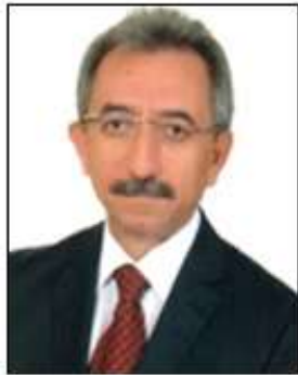
GENEL SEKRETER EYÜP ŞENOL ÖMEROĞLU