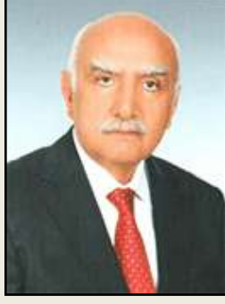
Meclis Başkanı EROL GEMALMAZ